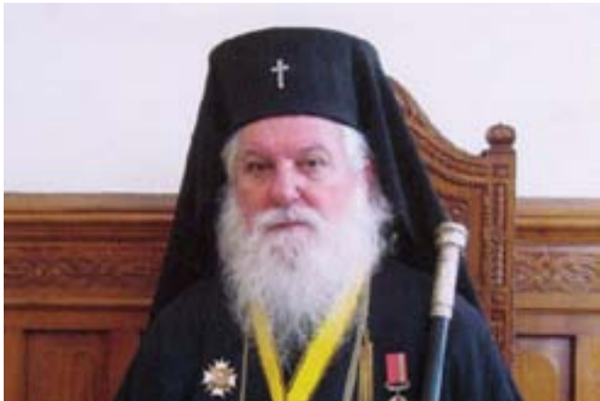
+ Видински митрополит Дометиан

„Хвалете Господа, всички народи, прославяйте Го, всички племена, защото Неговата милост към нас е велика, и истината Господня пребъдва вечно“.