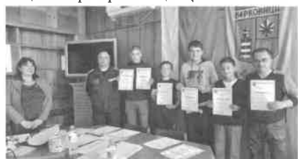
3. ОУ „Иван Вазов“ - Берковица

на община Берковица - 1. ОУ „Никола Вапцаров“ - Берковица, 3. ОУ „Иван Вазов“ — Берковица, 4. ОУ „Георги С. Раковски“ — Берковица, ОУ „Георги С. Раковски“ - село Бързия, ОУ „Св. Кирил и Методий“ - село Замфирово. Викторината се проведе в три кръга, като участниците решаваха листовки с 20 въпроса, тестове с 8 въпроса и практическа задача, включваща разпознаване значението на 9 пътни знака. След оспорвана надпревара и зададени допълнителни задачи поради равенство, престижното първо място зае постиг-