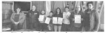
ОУ „Георги С. Раковски“ - с. Бързия