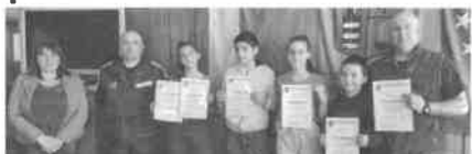
1. ОУ „Никола Й. Вапцаров“ - Берковица