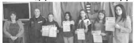
ОУ „Св. св. Кирил и Методий“ - с. Замфирово

наличият най-много точки отбор на 3. ОУ „Иван Вазов“ - Берковица и се класира за Областния кръг на състезанието, което ще се състои на 14 май 2022 в град Монтана. На второ място се нареди отборът на ОУ „Св. св. Кирил и Методий“ - село Замфирово, а трети остана 1. ОУ „Никола Вапцаров“ - Берковица. Целта на състеза-