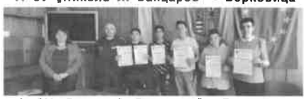
4. ОУ „Георги С. Раковски“ - Берковица